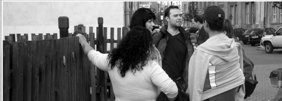
Romští a neromští figuranti při akci „volavka“