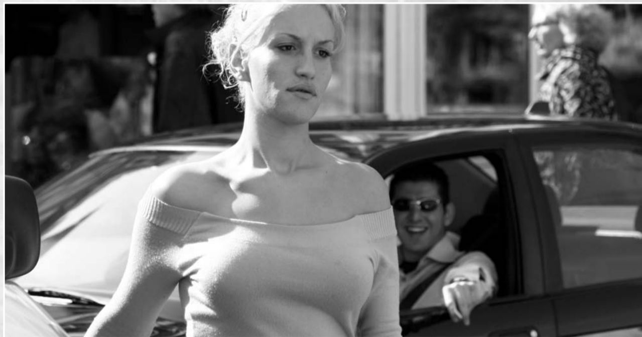
Ilustrační foto: Justyna Furmanczyk