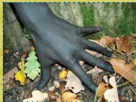
...z barvy kůže...