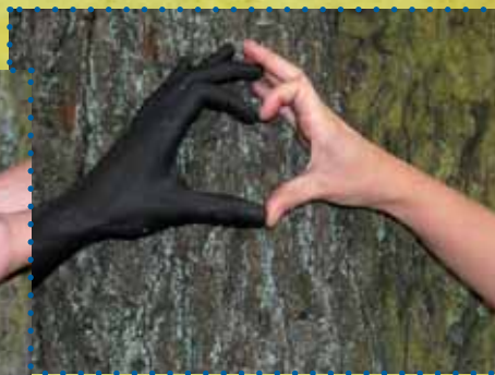
...z lidského srdce...