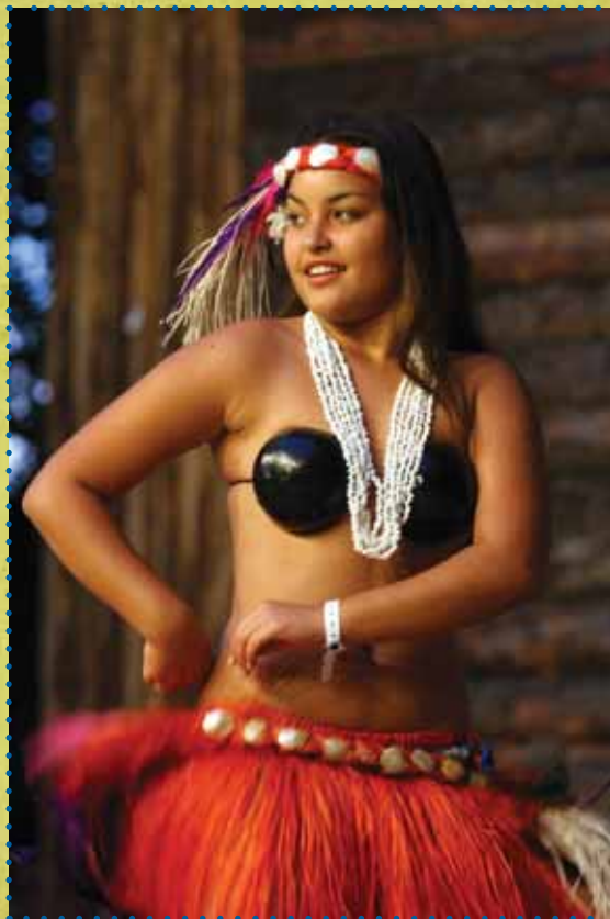
3. místo v kategorii „Fotografie“

Při jejím tanečním projevu na ní obdivuji to, že s nadšením prožívá svůj tanec a na její tváři je vidět, že chce lidem předat radost a požitek. Je krásné se na ni dívat. Dokonce se mě to snažila i naučit, byla velice trpělivá, protože my Evropané to nemáme „v krvi“. Mám ji moc ráda a jsem šťastná, že jsme kamarádky. Je pro mě výjimečná!