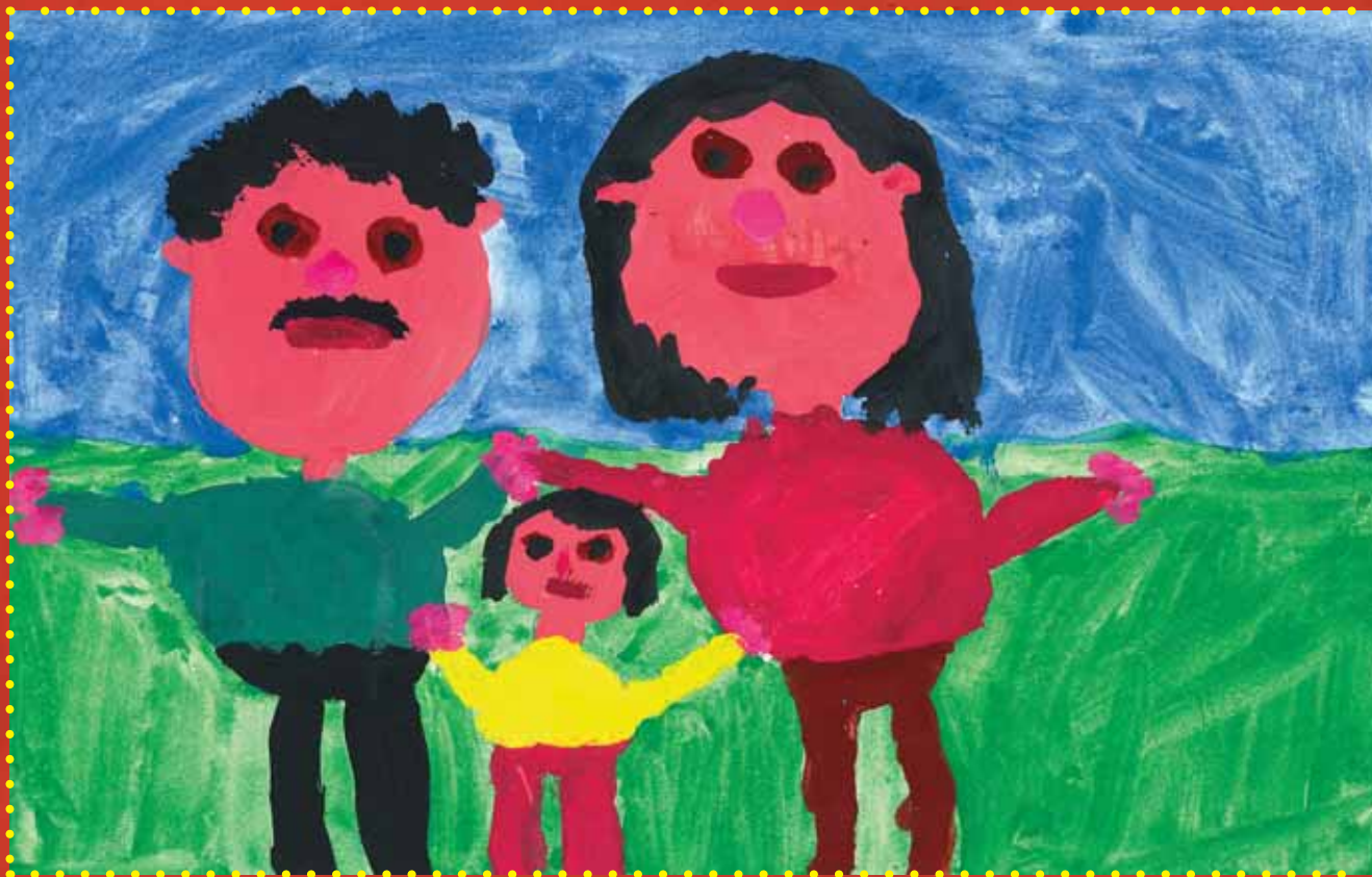
Tereza Lázoková Základní škola a Praktická škola, Český Brod