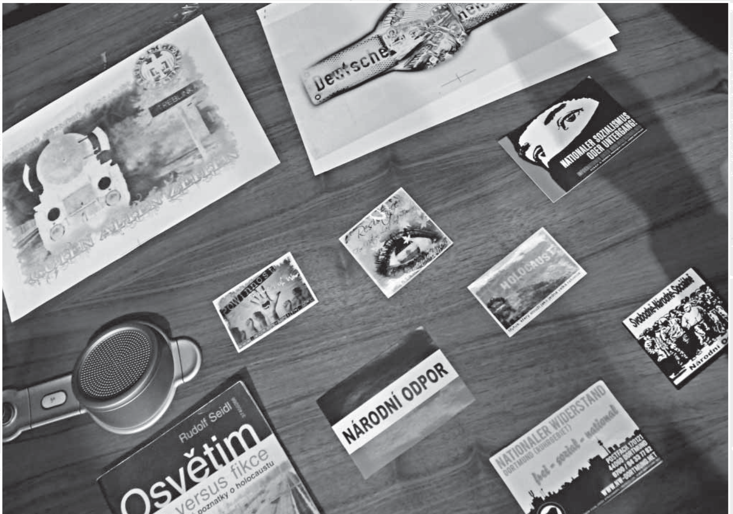
Neonacistické samolepky zabavené policií.