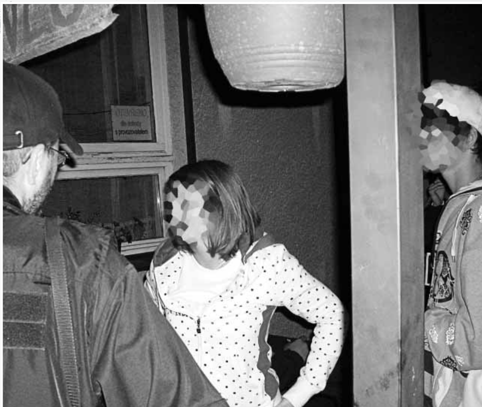
Policie zjišťuje totožnost většinou opilé omladiny.

bylo založeno v Pardubicích v roce 2002 mladými romskými aktivisty. Provozuje debaťní klub, jehož hlavním cílem je naučit romskou mládež správně argumentovat a propagovat vlastní názory s respektem k druhým. V roce 2007 byl dokonce jeho Debaťní klub vyhlášen Asociací debaťních klubů ČR za absolutního vítěze mezi všemi romskými debaťními kluby v ČR. Pardubický romský debaťní klub se také loni zúčastnil mezinárodního klání v Bulharsku, kde se setkala více jak pět set debaťerů z celého světa.