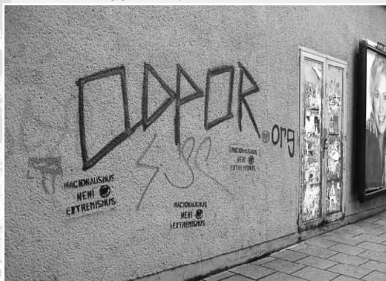
Neonacisti z Národního odporu dříve spílali sprejerům za to, že ničí fasády domů. Dnes ke své propagandě sami ničení fasád používají.