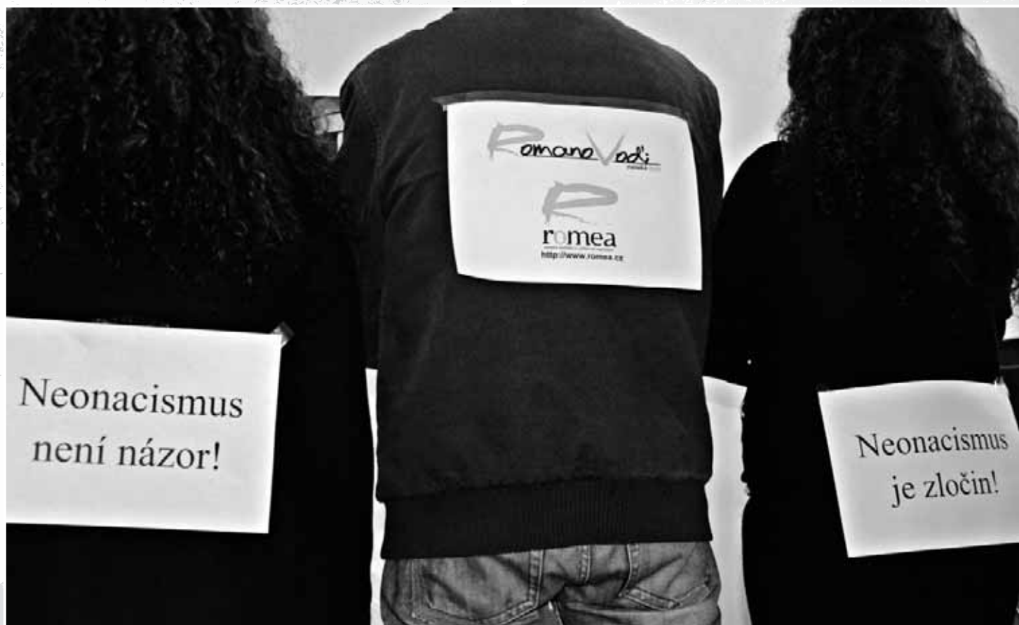
Neonacismus není názor, neonacismus je zločin.